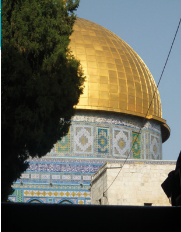
De gouden koepel

te geven en was behoorlijk confronterend. Het is zeker een aanrader om heen te gaan, mocht je ooit in Israël komen. Het heeft me wederom laten zien wat afschuwelijke periode dit is geweest, die zich nooit meer mag herhalen!